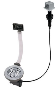
Vidange automatique LIRA 8407 103