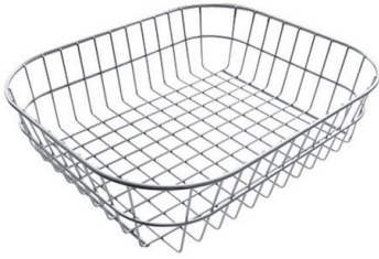
Panier en acier inoxydable 8611 000