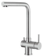
Mitigeur Gamma 3 vie - satiné 8496 100