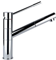
Mitigeur Lorenzo 8466 000